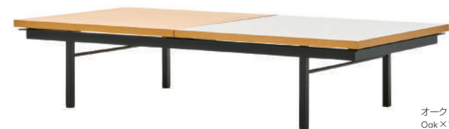
オーク × ホワイト Oak × White