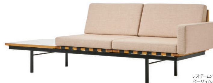
レフトアームソファウィズテーブル2シーター/ ベージュ (NC-121) / 天板ホワイト Left arm sofa with table 2-seater/ Beige (NC-121) / White top