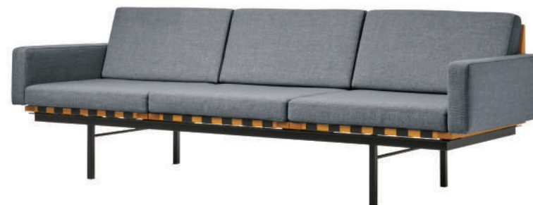
3シーター / ライトグレー (NC-126) 3-seater / Light gray (NC-126)