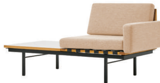
レフトアームソファウィズテーブル1シーター/ ベージュ (NC-121) / 天板ホワイト Left arm sofa with table 1-seater/ Beige (NC-121) / White top