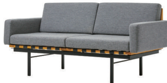
2シーター / ライトグレー (NC-126) 2-seater / Light gray (NC-126)