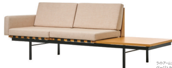
ライトアームソファウィズテーブル2シーター/ ベージュ (NC-121) / 天板オーク Right arm sofa with table 2-seater/ Beige (NC-121) / Oak top