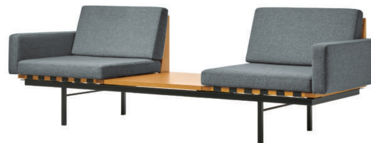
ウィズテーブル 2シーター / ライトグレー (NC-126) / 天板オーク With table 2-seater / Light gray (NC-126) / Oak top