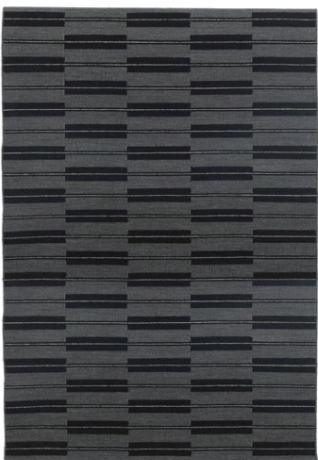
フランネルグレー

建築的なディテールと糸つむぎの道具であるドロップスピンドルの糸から着想を得て生み出されたデザイン”スピンドル”は、ブロックとラインによる幾何学的で大胆なパターンが特徴。