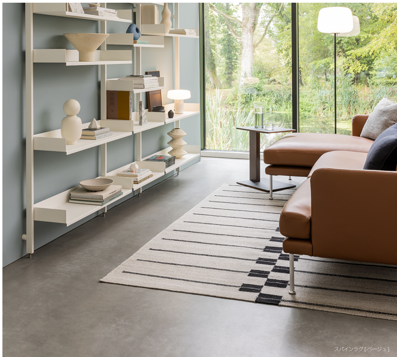
スパインラグ【ベージュ】

イギリスのテキスタイルデザイナー、エレノア・プリチャードによってデザインされたインド製の手織りラグです。素材には、ペットボトルなどのプラスチックを溶かしてポリエステル繊維に再加工したリサイクル素材「rPET」が用いられ、環境への配慮がなされています。