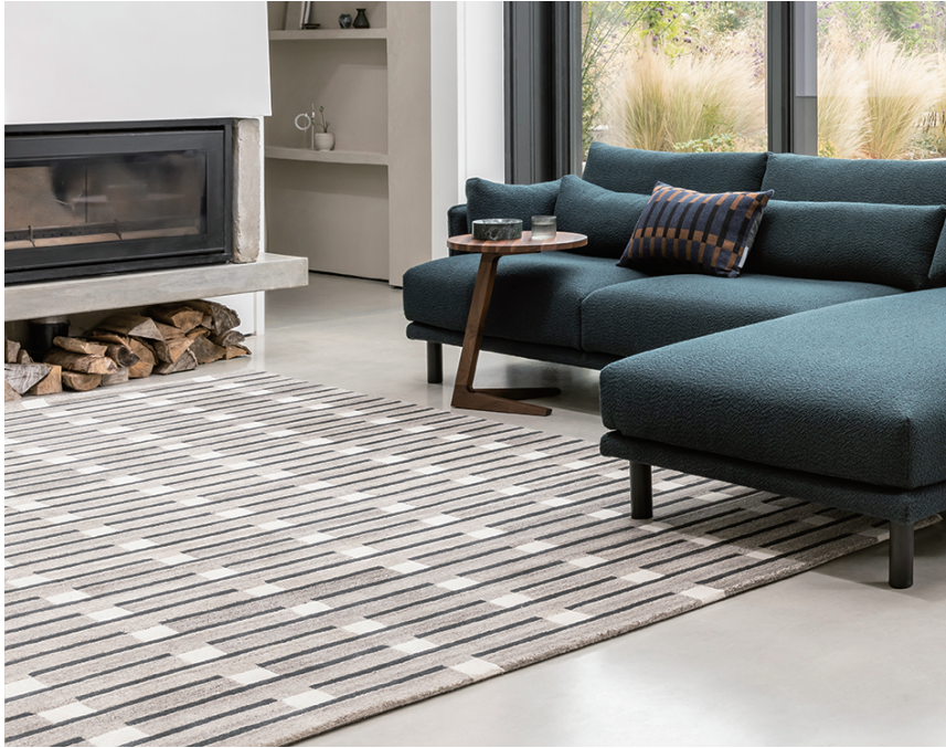
ポーリンラグ [ウォームグレー]