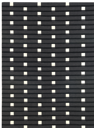
フランネルグレー

ロンドンビル群のスカイラインから着想を得て、“ポーリン”は母屋という意味のヴァナキュラー建築から取られました。細長い棒と四角いブロックを交互に並べた直線的なデザインは、グレーを基調とし、ロンドン大都会の美しさを見事に表現しています。