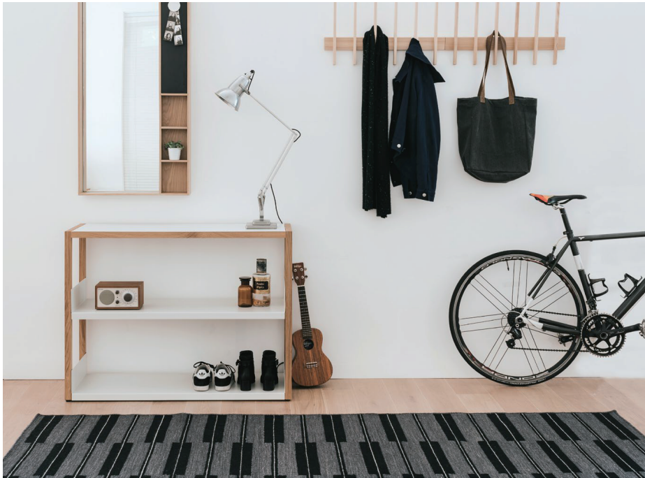
スピンドルラグ [フランネルグレー]