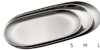
S M L